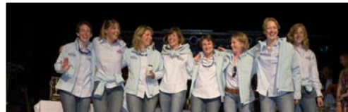
Freuen sich: Das Rügenfisch-Team. Foto: Hinrich Franck (65216)*