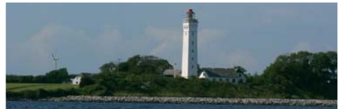
Endspurt: Wenn der Leuchtturm Keldsnor auf der Südspitze Langelands gerundet ist, geht es gerade nach Kiel. Ein mystischer Ort. Vor Skagen trifft die Nordsee auf die Ostsee.