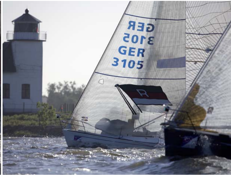
Harte Zweikämpfe auf der Elbe.