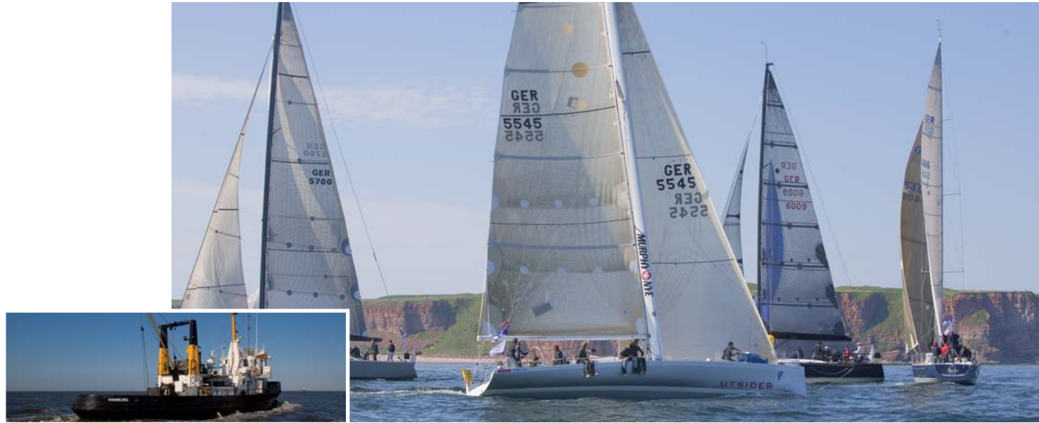
Die Esper Ort von Till Landsmann/Dockside ist das traditionelle Nordseewoche-Mutterschiff. Foto: Hans Genthe (66649)*