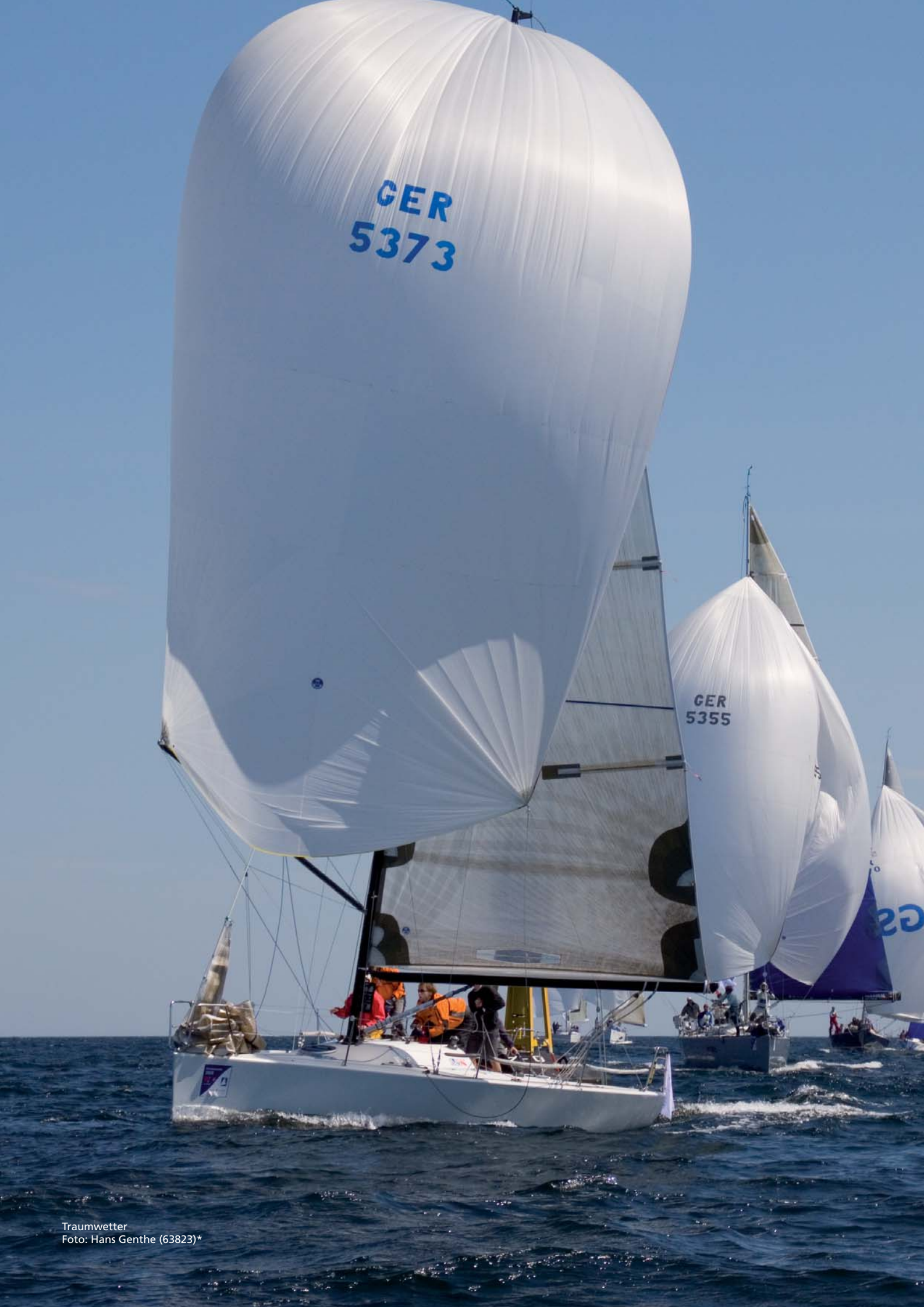
Traumwetter Foto: Hans Genthe (63823)*