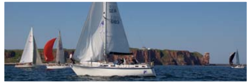
Vor Helgoland. (67277)*