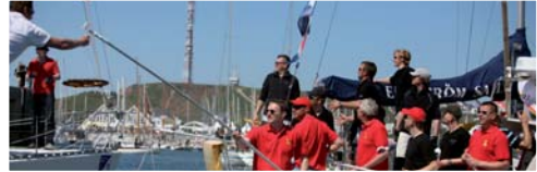
„Mount Gay“ heißt willkommen! Foto: Hinrich Franck (43816)*