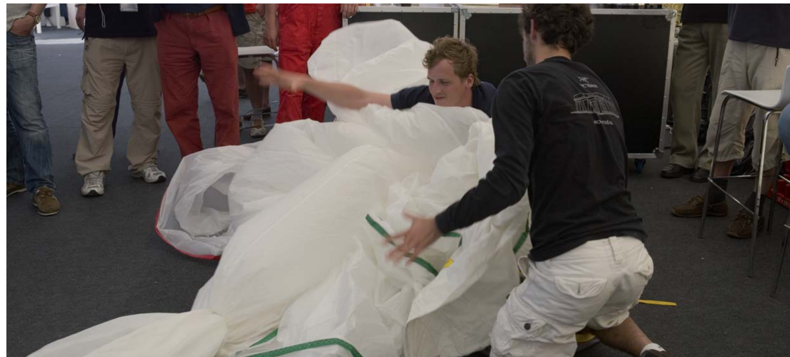
Action beim hanseboot Spi-Packing-Contest. Foto: Hinrich Franck (65202)*

Die Mädels und Jungs von Neumann Yachting reparieren Segel – notfalls bis in die Nacht – und sind Prime Sails Vertreter. Foto: Hans Genthe (67194)*