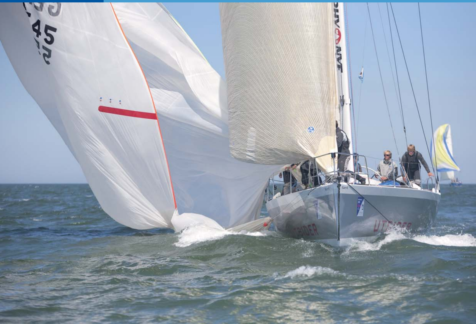
Utsider - ein Jugend-Segel-Projekt. Foto Hinrich Franck (63688)*