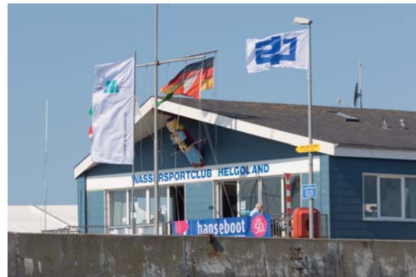
Das Wettfahrtbüro (Pressecenter im Keller).

Daytime attractions of the "Red Rock" can be discovered like the "Lange Anna", the "Lummenfelsen" or the beautiful views over the wide sea. And don't miss the all day duty-free shopping!