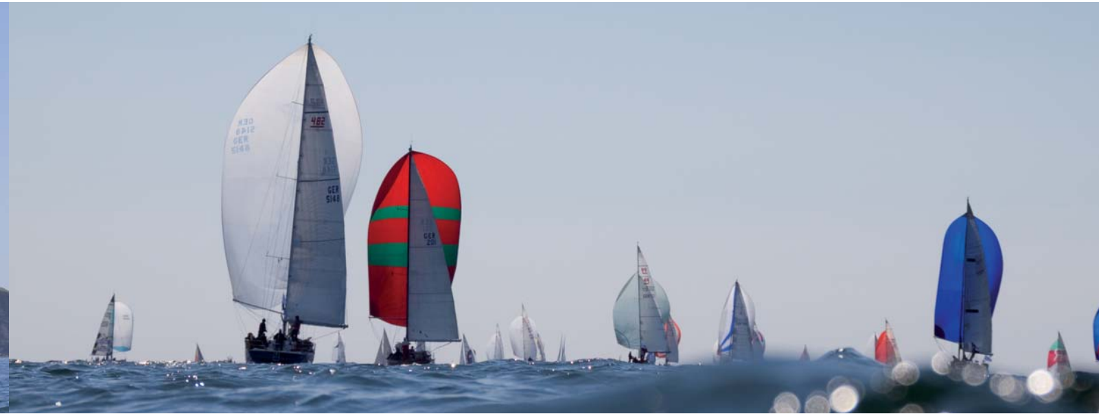
Nordseewetter. Foto: Hans Genthe (63826)*