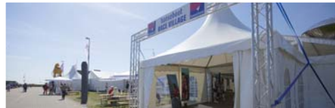
Alexseal Offshore Lounge (65277)*