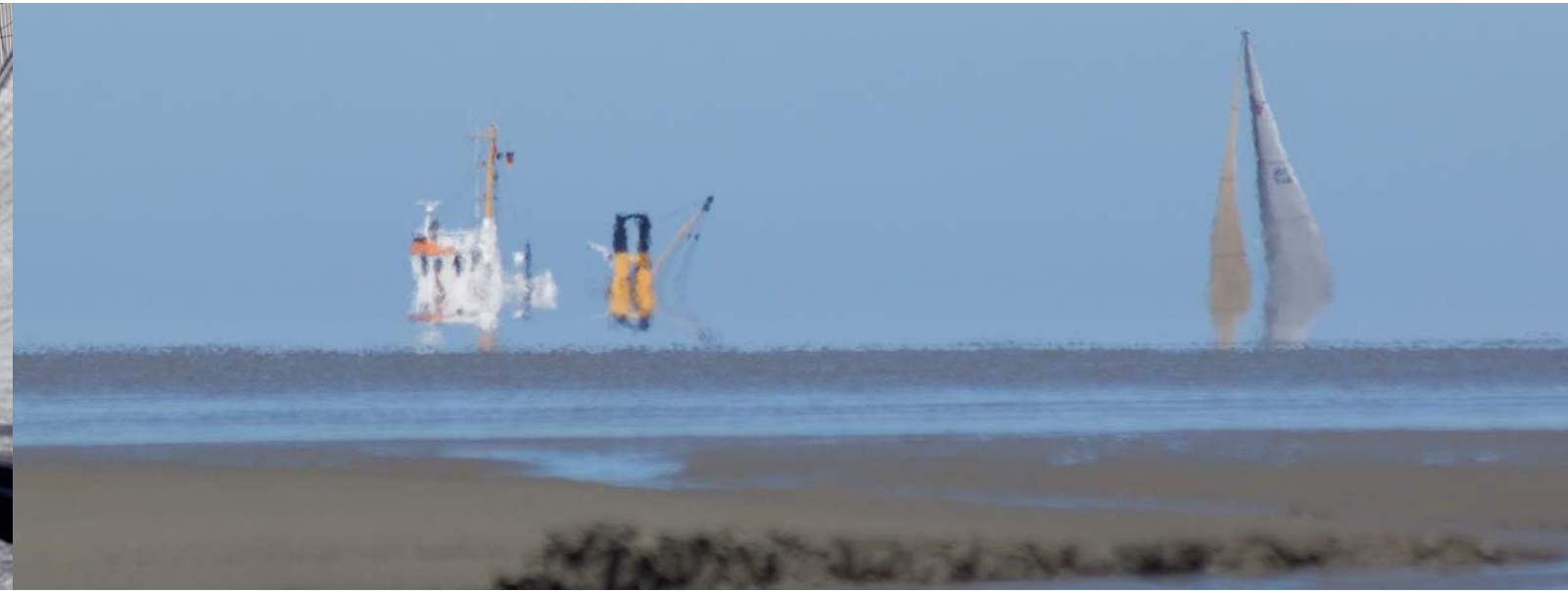
Herausforderungen: Tidenhub und Sandbänke.