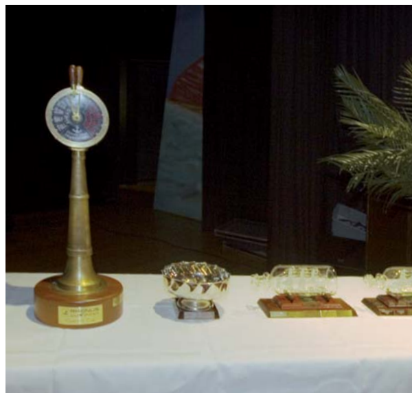
Den Cuxport-Preis (links) erhält das erste Schiff berechnet nach ORC Club für die Strecke Cuxhaven-Helgoland. Weitere Preise warten.