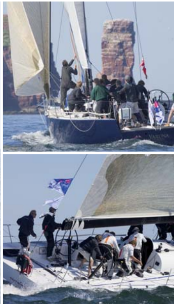
„Varuna“ (63949)* „Outsider“ (63751)*