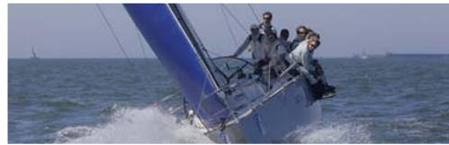
„Beluga Sailing Team“, Foto: Hinrich Franck (64111)*