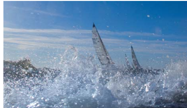
„SE Vibe Out“. Foto: Hans Genthe (66509)*

Mit der SE Spezial-Electronic AG konnte ein erfahrener Partner gewonnen werden, der sich seit längerem im deutschen Segelsport erfolgreich engagiert. Die SE Spezial-Electronic AG vertreibt seit über 35 Jahren elektronische Bauelemente für die Zielmärkte Industrieelektronik, Netzwerk- und Telekommunikation, Automotive, Medizin- und Sicherheitstechnik. Das Unternehmen hat seinen Hauptsitz in Bückeberg (Niedersachsen) und verfügt über Vertriebsbüros in Berlin, München, Dortmund, Ellwangen sowie über Auslandsniederlassungen in Moskau, Sankt Petersburg, Prag, Warschau und Enschede (Niederlande).