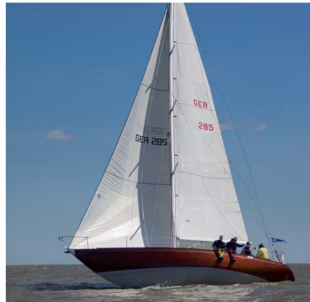
Hat schon viele Nordseewochen hinter sich: GER 285, Taifat, IOR Eintonner.

Die „hanseboot Acht“ zeichnet sich durch zwei entgegengesetzte Kurse zwischen Düne und Helgoland aus. Das Fahrwasser wird hier schmal und außerhalb des Kurses muss schnell mit Flachwasser gerechnet werden. Hier ankern auch die Seebäderschiffe, die mit Börtebooten ihre Passagiere aussetzen und wieder an Bord nehmen. Wind und wechselnder Tidenstrom machen die Wettfahrt besonders spannend. Die „hanseboot Acht“ ist eine reizvolle Regatta, die ihre Teilnehmer zusätzlich mit aufregenden Blicken auf das rote Eiland belohnt.