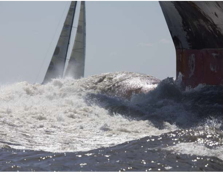
Berufsschiffahrt – taktische Herausforderungen. Foto: Hinrich Franck (63487)*