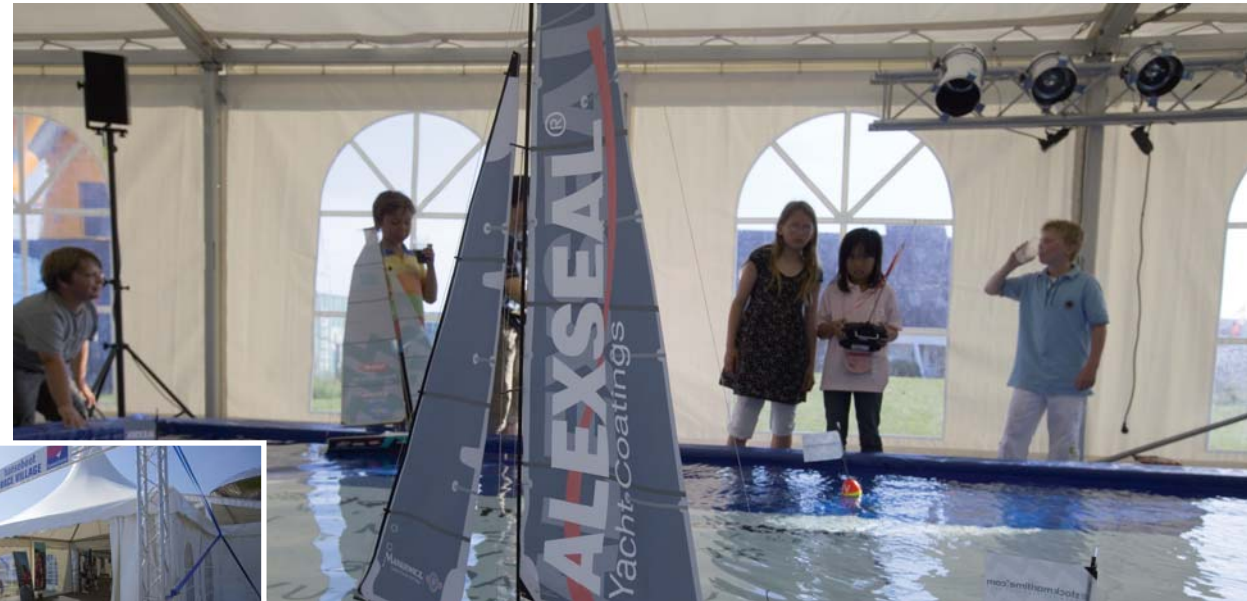
Segelspaß in der Alexseal Offshore Lounge, Foto: Hinrich Franck (65282)*