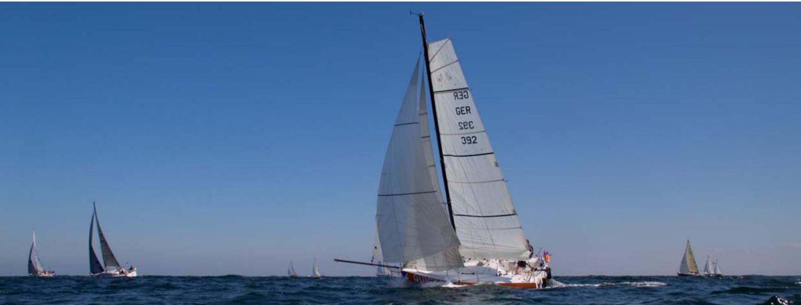
Mini 650 auf dem Weg nach Helgoland. Foto: Hans Genthe (64967)*