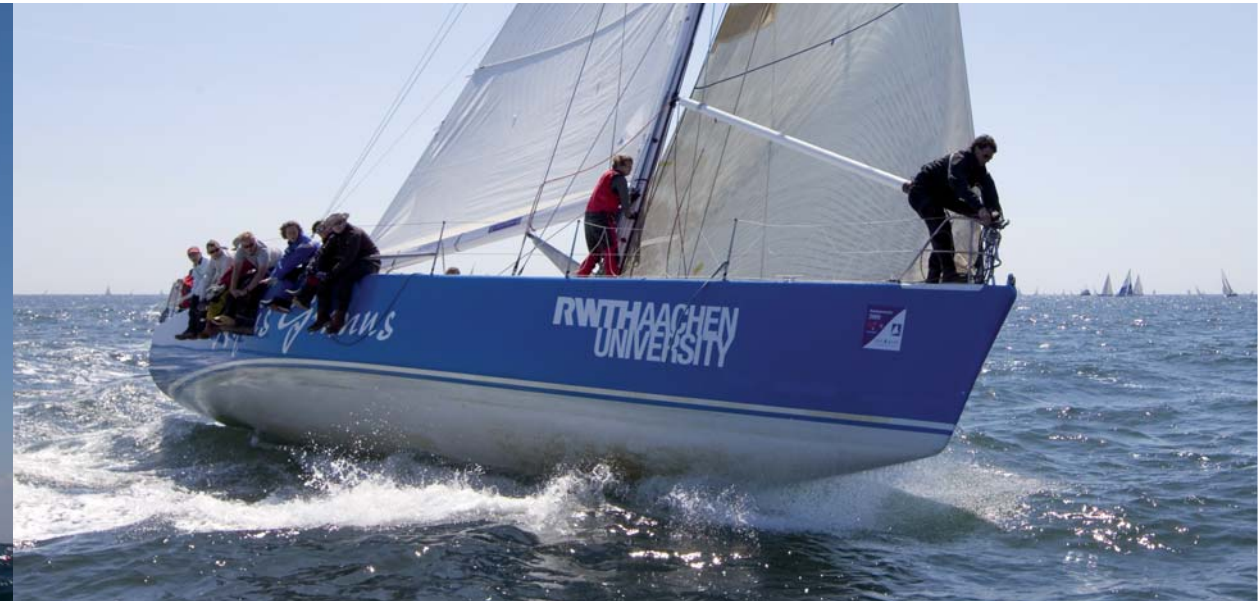
„Aquis Granus“ auf dem Sprung zum Felsen. Fotos: Hinrich Franck (63763)*