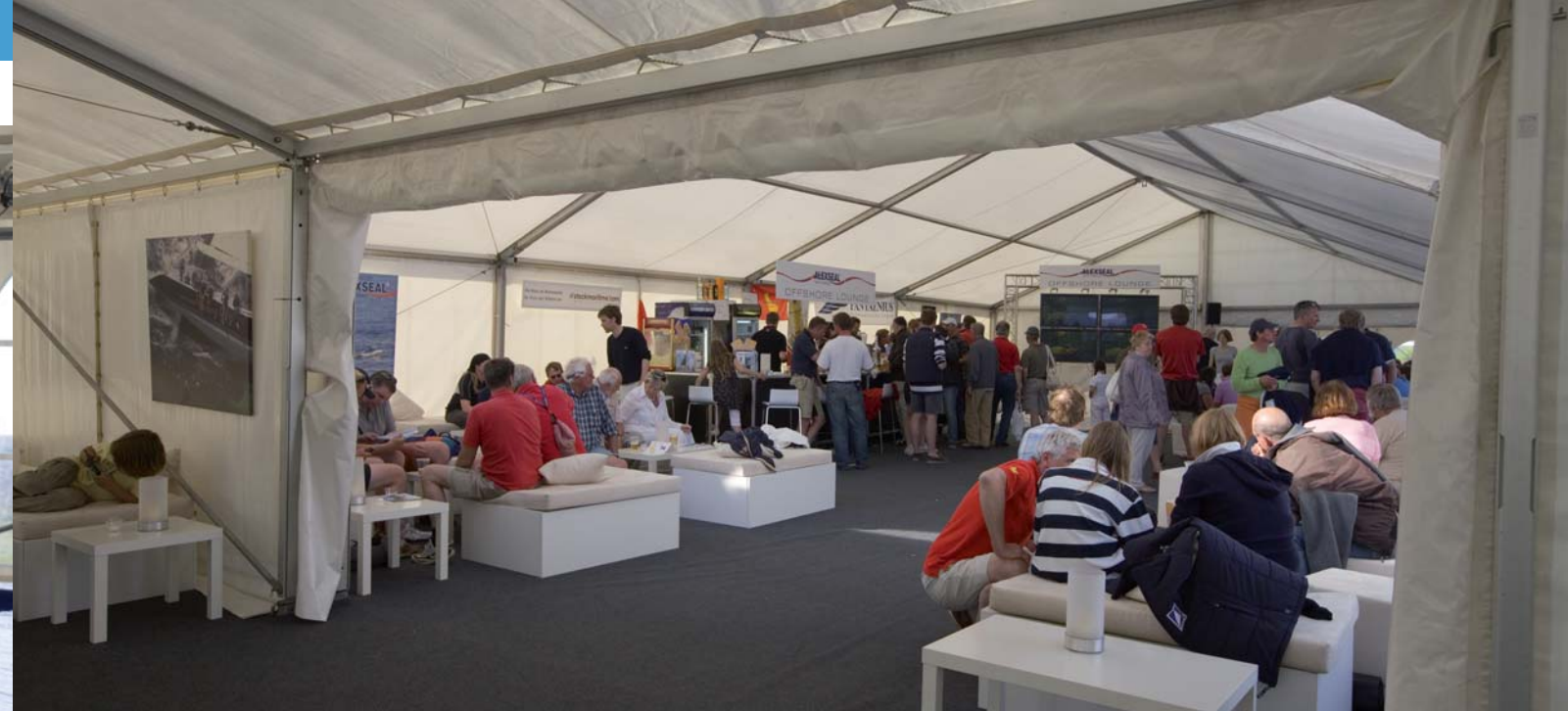
Come in and chill out – Alexseal Offshore Lounge im Hanseboot Race Village. Foto: Hinrich Franck (65286)*